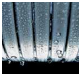
Surface d'échange Inox-Radial

Les chaudières gaz à condensation Vitodens 200-W et 222-W offrent des solutions efficaces et rentables pour les petits et les grands besoins de chaleur.