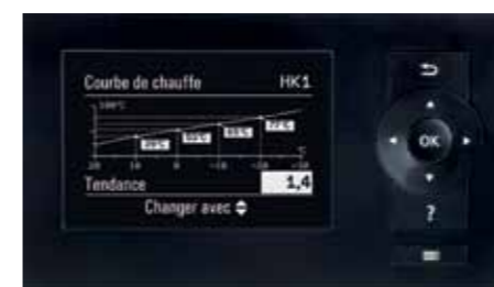
Régulation Vitotronic – facilité d'utilisation grâce au guidage de l'utilisateur par les menus et à l'affichage graphique, p. ex. celui des courbes de chauffe