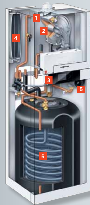
Vitodens 222-F avec réservoir d'eau chaude à serpentín émaillé pour les régions où l'eau est dure

Grâce aux ensembles de raccordement et à la position contre le mur, cet appareil compact offre une souplesse d'utilisation particulièrement élevée. Il est préassemblé en grande partie et rapide à installer. De plus, grâce au pourcentage élevé de composants similaires aux autres appareils compacts à condensation de Viessmann, les travaux d'entretien et de maintenance sont rapides et peu coûteux.