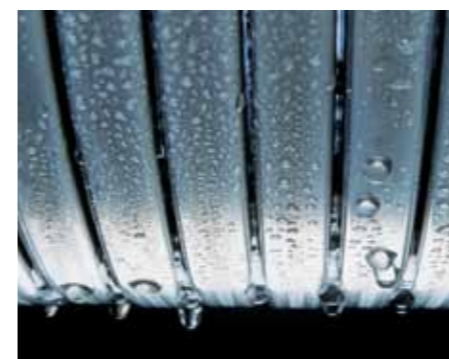
Surface d'échange Inox-radial